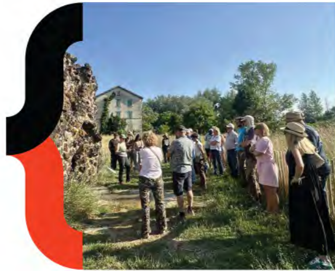
MA Auvergne - Réenchantons les thermes de Sainte Marguerite Saint Maurice - 2025

Ralentir. Faire une pause. Prendre du recul. C'est ce que nous nous étions promis il y a cinq ans.