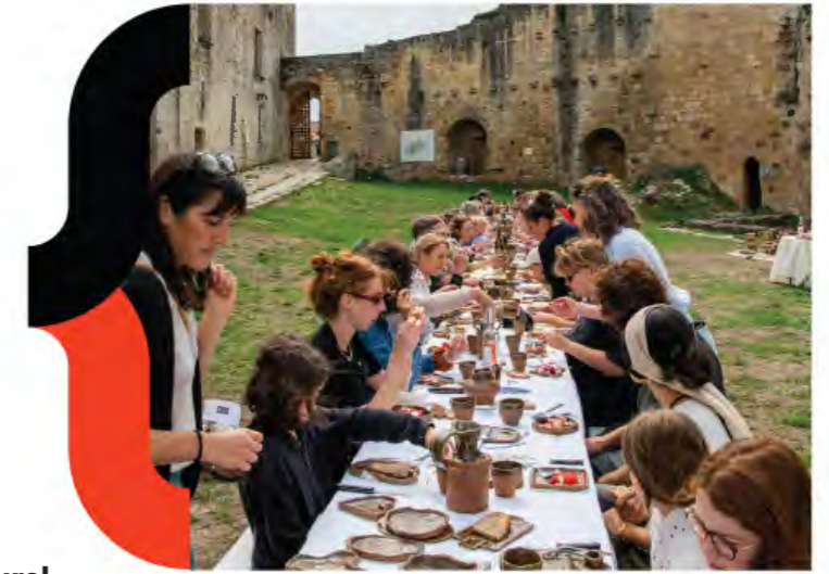
308 MA_Terre nourricière - Rauzan - 2025

Afin de permettre à tous de suivre le déroulement des résidences, chaque équipe créera et alimentera un site/blog dédié à la résidence et pourra produire un support de synthèse présentant leur démarche et leurs réalisations.