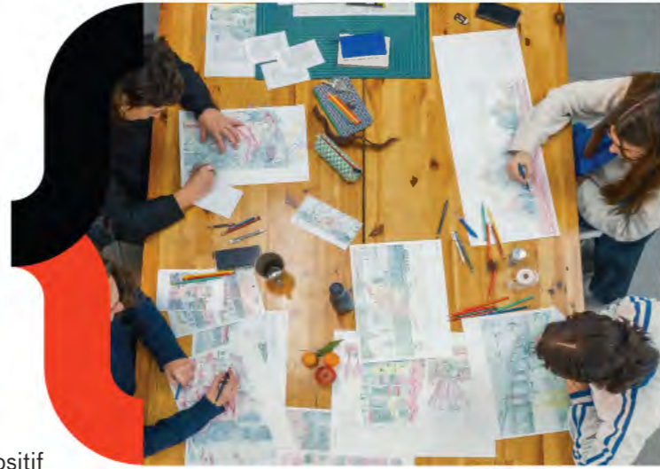
Territoires pionniers - Bassin de Caen, quels futurs - 2025

En 2026, le Réseau des maisons de l'architecture, grâce au mécénat de la Caisse des dépôts, a lancé un nouveau programme qui vise à travailler , par le prisme de l'architecture, du paysage et du cadre bâti, sur des thématiques engagées autour de questions environnementales et sociales , de résilience, de ménagement des territoires, de transition écologique, de mutations architecturales en impliquant toutes les actrices et tous les acteurs au contact de tous les publics.