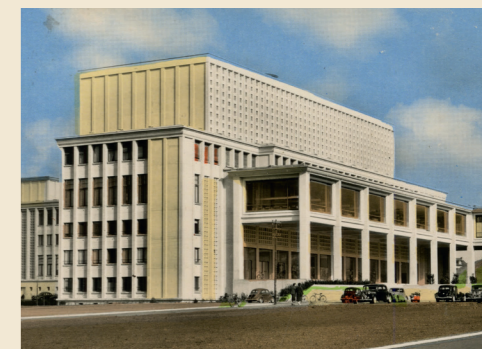
Le bâtiment Droit et la bibliothèque de l'université fin des années 1950.

Rendez-vous : sculpture du Phénix, université de Caen Inscription : mdn-reservation@caen.fr