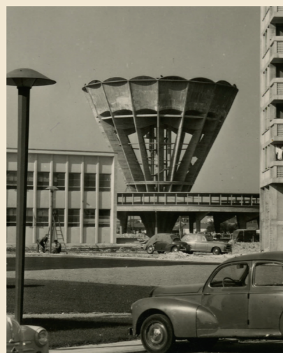
Le château d'eau de la Guérinière en 1960.

Rendez-vous : château d'eau, place de la Justice, Caen Inscription : mdn-reservation@caen.fr