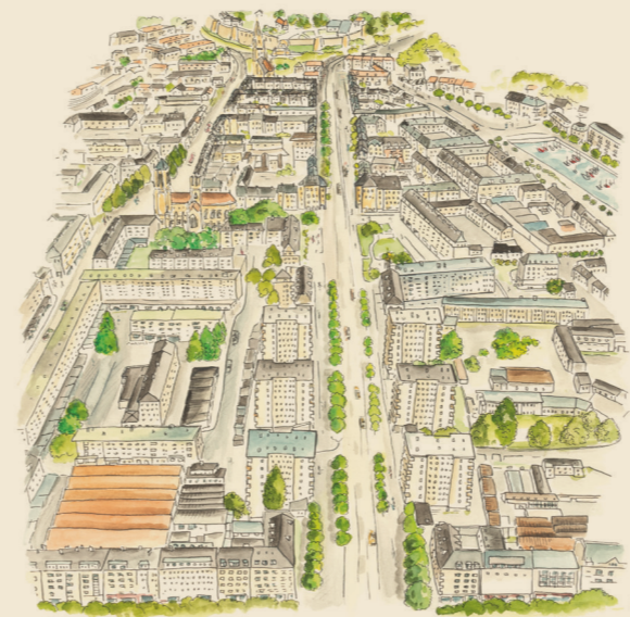
Vue du quartier Saint-Jean. Aquarelle Lina Faillancier. Musée de Normandie - Ville de Caen

Ville de Caen - 2023 - conception : www.pimenta-studio.fr