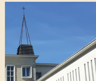
Extérieur de la chapelle de la Sainte-Famille de l'établissement l'Oasis.

Durée : 1h • Rendez-vous : tour Leroy, boulevard des Alliés, Caen • Inscription : mdn-reservation@caen.fr