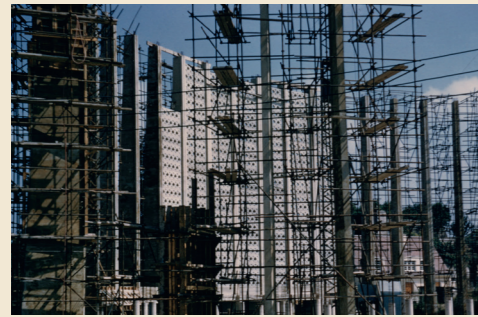
Nouvelle église Saint-Julien en construction - Musée de Normandie - Ville de Caen